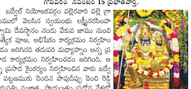
గోవరం నవంబర్ 15 ప్రభాతవార్త.