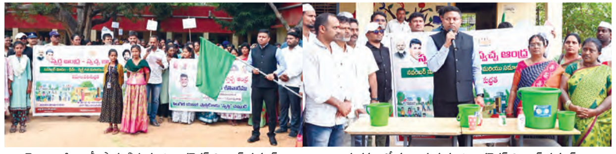
జిందా ఊపి రక్షింపు ప్రారంభిస్తున్న జిల్లా కలెక్టర్ సి.ఎం. కుమార్