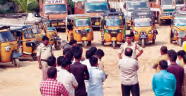
కడప క్రైం, నవంబరు 15, ప్రభాతవార్త:

కడప క్రైం, నవంబరు 15, ప్రభాతవార్త: జిల్లా ఎస్పీ ఆదేశాల మేరకు శనివారం మైదుకూరు పట్టణంలో సీబి రమణారెడ్డి అంతామ్మ గుడి వద్ద అటో డ్రైవర్లకు కౌన్సెలింగ్ నిర్వహించారు. పరిమితికి మించి ప్రయాణికులను ఎక్కించుకోవడం, తప్పునిరంధ్ర డ్రైవర్ల వైస్సార్ కలిగి ఉండాలన్నారు. డ్రైవరు సీటు వక్రం ఎవరూ కూర్చోరాదన్నారు. మోటారు వాహనాల చట్టం నిబంధనలు పాటించాలన్నారు.