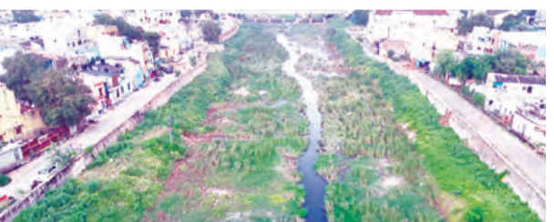
నగరంలో డ్రోన్ కెమెరాలతో నిఘా