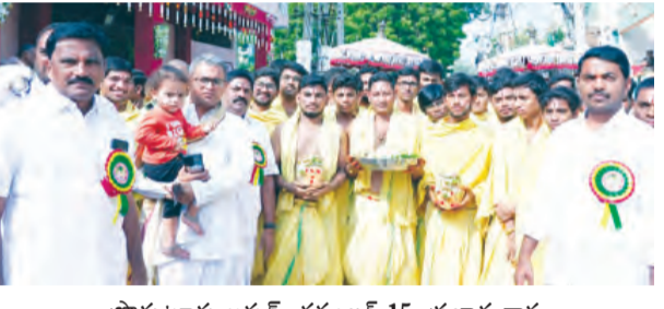
ప్రావీణ్ అర్చన, నవంబర్ 15, ప్రభాత వార్త

వచ్చుశాలియుల కుల దైవం శ్రీ భావనారాయణ స్వామి వారి వార్షిక బ్రహ్మోత్సవాలలో భాగంగా రెండవ రోజు భద్రాచలం శ్రీ బీజమ్మల దేవి విభావనారాయణ స్వామి వారి బంధన మహోత్సవాన్ని అంగరంగ వైభవంగా నిర్వహించారు. ఈ సందర్భంగా ఉదయం స్నాన శ్రీరామనగర్, రామేశ్వరం లో వున్న శ్రీ భద్రాచలం దేవి సమేత భావనారాయణ స్వామి వారి ఆలయంలో ఆలయ మూలవిరాట్టులకు విశేష గోష్ఠి, పంచామృత అభిషేకాలు, ప్రత్యేక పూజలు నిర్వహించారు. కాగా దీక్షదారులైన స్వామి లతో ఆలయ అర్చకులు హోమాలు నిర్వహించారు. అనంతరం ఆలయాల నుండి వెన్నకేవల స్వామి ఆలయం, అగస్త్యశ్రీరాయలనికీ దీక్షదారులైన స్వామిలతో మేళ తాళాలు, జానపద నృత్యాల మధ్య చేరుకొని అక్కడ నుండి స్వామి, అమ్మవారి మార్చులతో కూడిన బంధన మహోత్సవాన్ని తీసుకుని ఆలయ పుర వీధుల గుండా గ్రామాత్మకంగా తిరిగి ఆలయానికి వచ్చారు. సాయంత్రం ఆలయ సమీపంలో గ్రామాత్మకం నిర్వహించారు. కాగా నేడు లోకకళ్యాణార్థం స్వామి, అమ్మవారి కళ్యాణం నిర్వహించనున్నారు. ఉత్సవమిటీ సభ్యులు పాల్గొన్నారు.