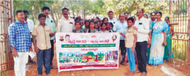
దువ్వూరు, నవంబర్ 15, ప్రభాతవార్త: